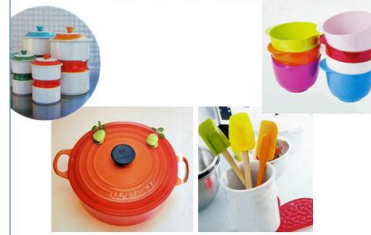
図1 kitchen iQのコンセプト